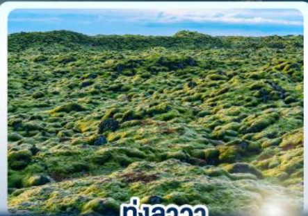
ทุ่งลาวา