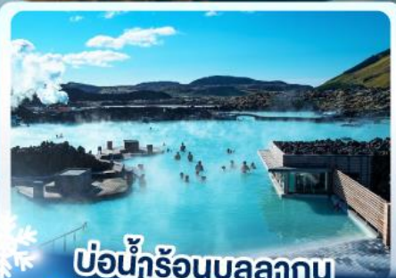
แช่น้ำร้อนบลูลากูน

เก็บไอซ์แลนด์ แดนภูเขาไฟคิร์กจูฟลา และ แช่น้ำร้อนบลูลากูน