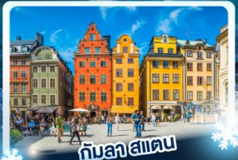
กับลาสาเตน