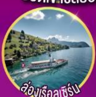
ล่องเรือลูซิิร์น