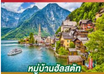
หมู่บ้านอัลสตัด