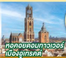
หอคอยดอกทาวเวอร์ เมืองอูเทรคต์