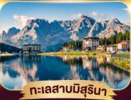
ทะเลสาบมิสูรีนา