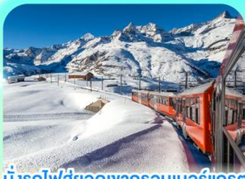
นั่งรถไฟสู่อยอดเขากรอนเนอร์เกรต