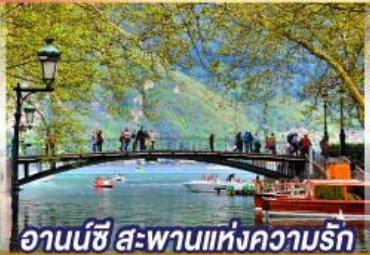
อานน์ซี สะพานแห่งความรัก