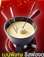
เมนูพิเศษ ชีสฟองดู

2 ยอดเขาที่สวยงามที่สุด Jungfrau และ Matterhorn รวมตั๋วรถไฟ Glacier Express และ Gornergrat train เมืองมองเทรอ ปราสาทซิลยออง เวเวย์ รูปปั้นชาร์ลี แชปลิน โลซาน ศาลาไทย เบิร์น ลูเซิร์น สะพานไม้ชาเปล ลิงโตสะอื่น ทะเลสาบสิมรกต เบลาเช