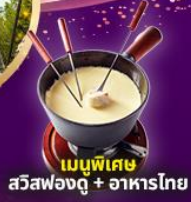
เมนูพิเศษ สวิสฟองดู + อาหารไทย

เมืองมอญเทรอ ปราสาทซิลยอง เวเวย์ รูปีนชาร์ลี แซปลิน อินเตอร์ลาเคน ลูเซิร์น สะพานไม้ซาเปลา ลิงโตสะอัน น้ำตกไรน์ หมู่บ้านอิเซลทัวอลด์ ทะเลสาบเบรียนซ์ ซูริก