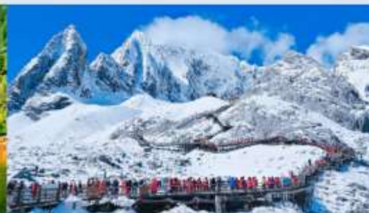
ภูเขาหิมะมิงกรหยก