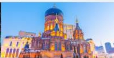
โบสถ์เซนต์ไอแซค