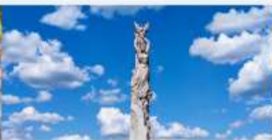
สวนประติมากรรมโลกฉางชุน