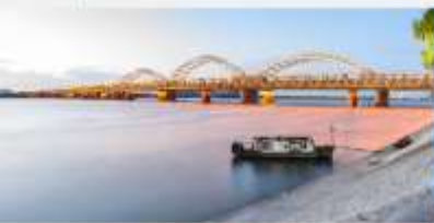
สะพานชงฮวาเจียง