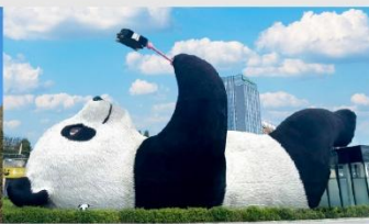
รูปปั้นหมีแพนด้าบนเซลฟี่