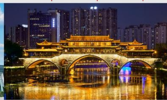
สะพานอันซุน