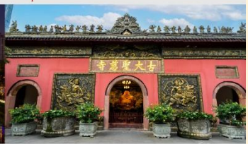
วัดต้าจื่อ